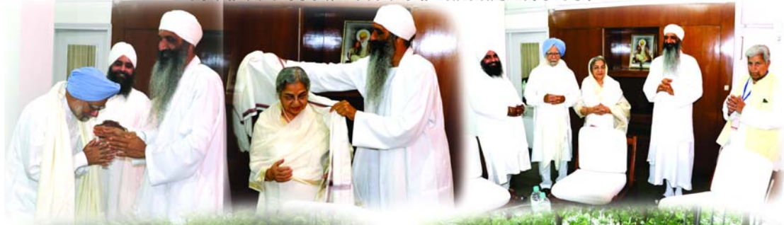
ਗੁਰਦੁਆਰਾ ਰਤਵਾੜਾ ਸਾਹਿਬ ਕਾਰ ਸੇਵਾ ਦ੍ਰਿਸ਼।