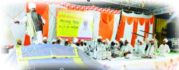
ਪਿੰਡ ਲੋਹਗੜ੍ਹ ਫਿਡੇ (ਰੋਪੜ)