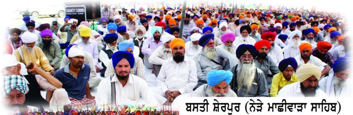
ਬਸਤੀ ਸ਼ੇਰਪੁਰ (ਨੇੜੇ ਮਾਛੀਵਾੜਾ ਸਾਹਿਬ)