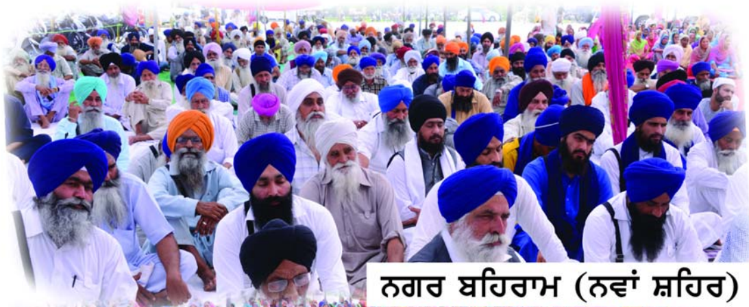
ਨਗਰ ਬਹਿਰਾਮ (ਨਵਾਂ ਸ਼ਹਿਰ)